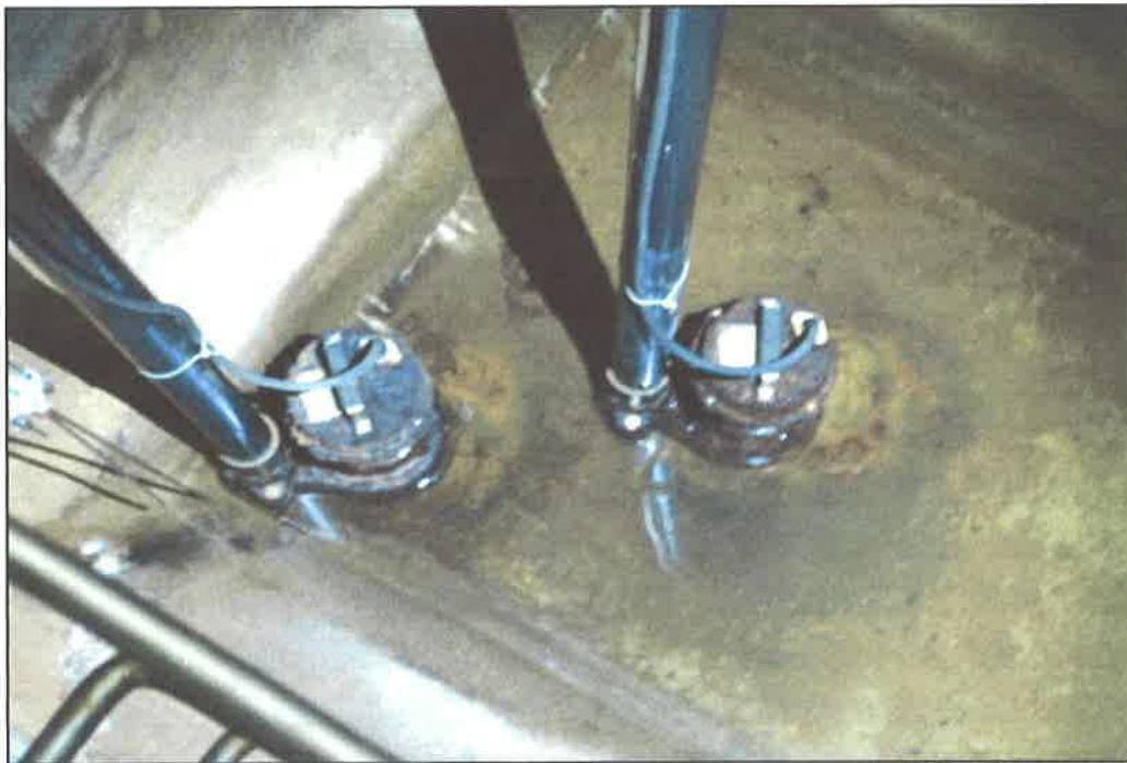
付属棟 排水ポンプ