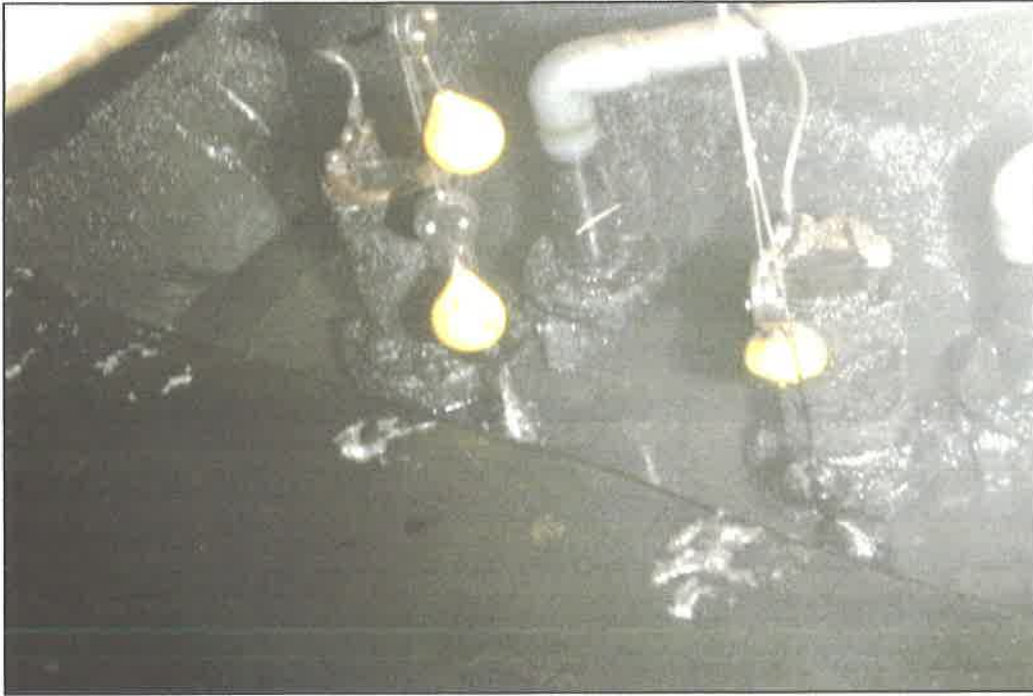
厚生棟 汚水ポンプ